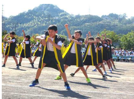
【ソーラン ポーズが決まった！】