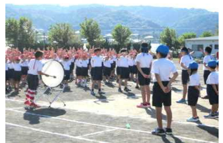
【声を限りに エール交換】