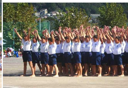
【さすが 5, 6年生 見事な シンクロ】