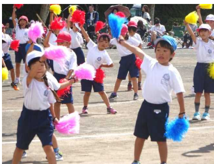
【笑顔のシャオイーシャオ】