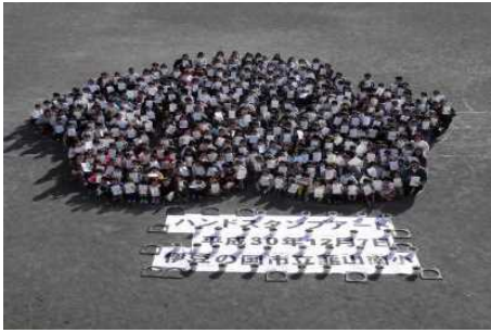
【全校ハンドスタンプアート】 11月に作ったハンドスタンプを 持って、花を表現しました。