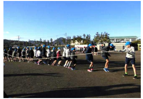
【6年生 学年集会】 長縄「みんなでジャンプ」に 挑戦。「せーの。1・2・3・・・」