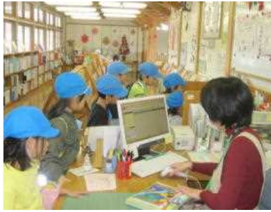
【2年生 葦山図書館見学】 たくさんの本にびっくり。 本も借りました。